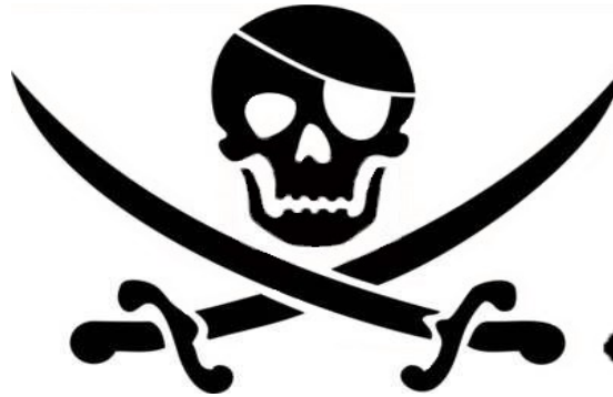
2. junge Hauptfigur 3. Anführer