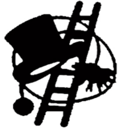
4. Der beste Freund der Hauptfigur 5. Hauptfigur