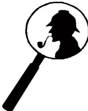
7. Hauptfigur 9. Sein treuer Begleiter