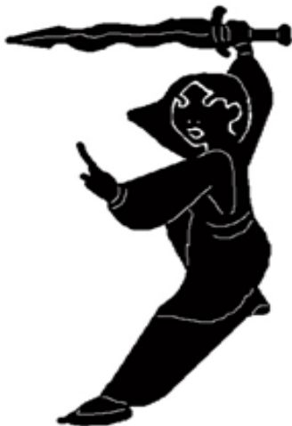
1. Hauptfigur als ♀ 6. Hauptfigur als ♂